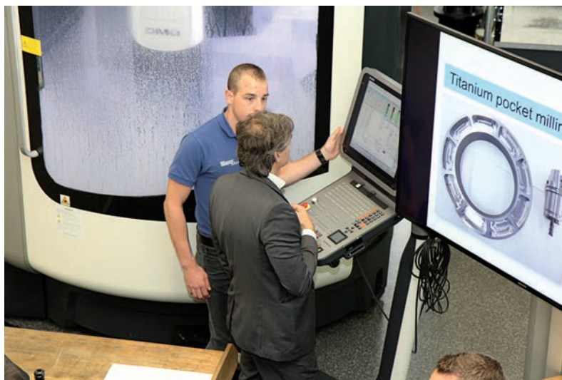
Blaser Swissslube s'engage avec ses clients pour la recherche de résultats mesurables.

Dans la recherche d'avantages toujours plus importants, le conseiller Blaser Swissslube dispose des meilleurs outils pour aider les sous-traitants pour leur benchmark sur les meilleures pratiques. A partir du logiciel Analyzer, il établit un pré-diagnostic 2.0 prenant en compte leur environnement et leurs objectifs de production. Spécialement développé par Blaser Swissslube, celui-ci va cibler les technologies de lubrifiant adaptées à leur besoin et formaliser un engagement sur les gains escomptés.